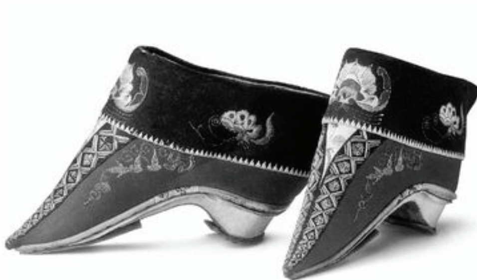
纏足後穿的小腳鞋